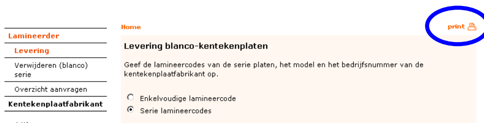
Figuur 2-3: de “print”-knop in GAIK Online

Desgewenst kan ook alleen het middelste deel van het scherm worden afgedrukt door de “print”-knop te gebruiken die zich rechtsboven in alle schermen van de webapplicatie GAIK Online bevindt.