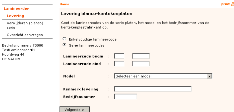
Figuur 2-1: Eerste pagina van de webapplicatie GAIK Online voor lamineerder

Na het inloggen en het selecteren van “GAIK Online” in de RDW WebDirect Portal verschijnt de webapplicatie GAIK Online.