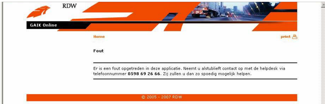
Figuur 2-7: Foutpagina bij technische problemen

Wanneer de applicatie technische problemen ondervindt tijdens het gebruik wordt een foutpagina getoond zoals in figuur 2-7.