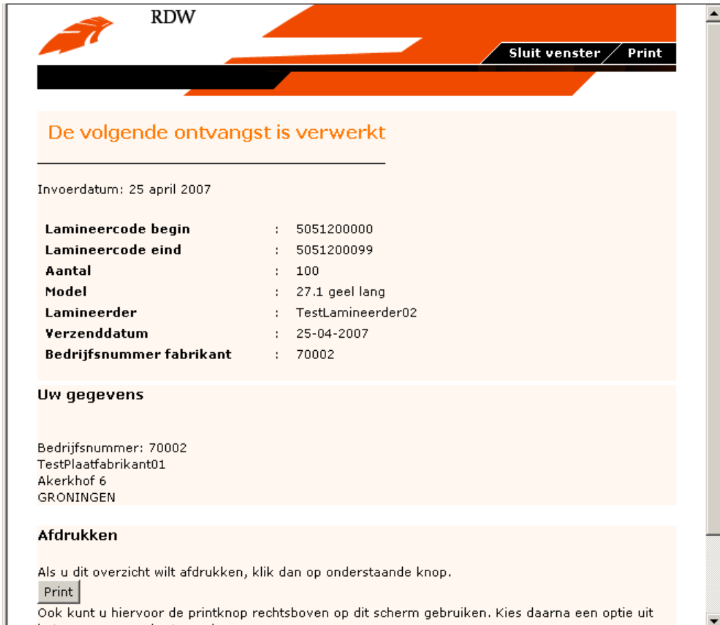
Figuur 2-4: het "print"-scherm

Het "print"-scherm bestaat uit een standaard RDW-kopregel met twee knoppen, "Sluit venster" en "Print". Onder de kopregel worden alleen de (eventueel ingevulde) gegevens getoond van het middelste deel van het scherm, en niet het menu links of de afbeelding rechts. Met de knop "Sluit venster" wordt het "print"-scherm gesloten en met de knop "Print" wordt de inhoud van het "print"-scherm afgedrukt.